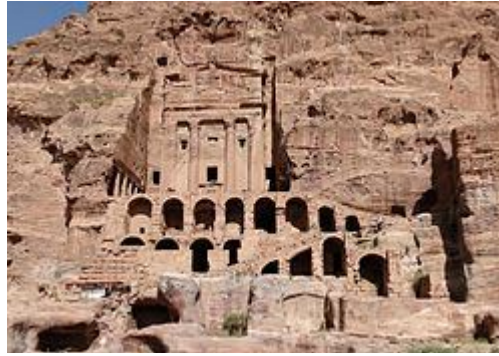
مبنى المحكمة أو قبر الجرة بالبتراء