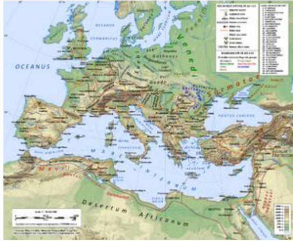
خريطة الإمبراطورية الرومانية تحت حكم الإمبراطور هادريان (حكمت من 117-138)، تظهر موقع العرب الأنباط في المناطق الصحراوية حول مقاطعة البتراء الرومانية