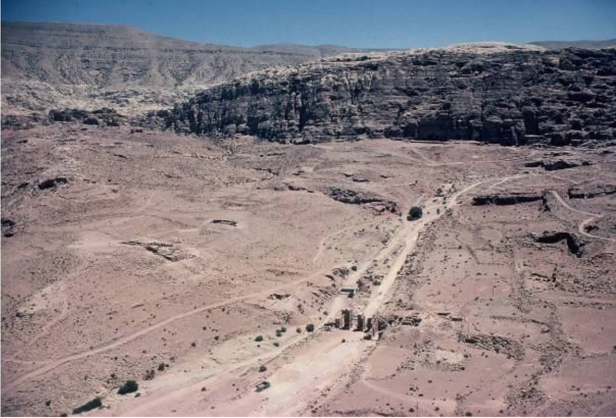
صورة جوية لوسط مدينة البتراء الصورة التقطت عام 1980