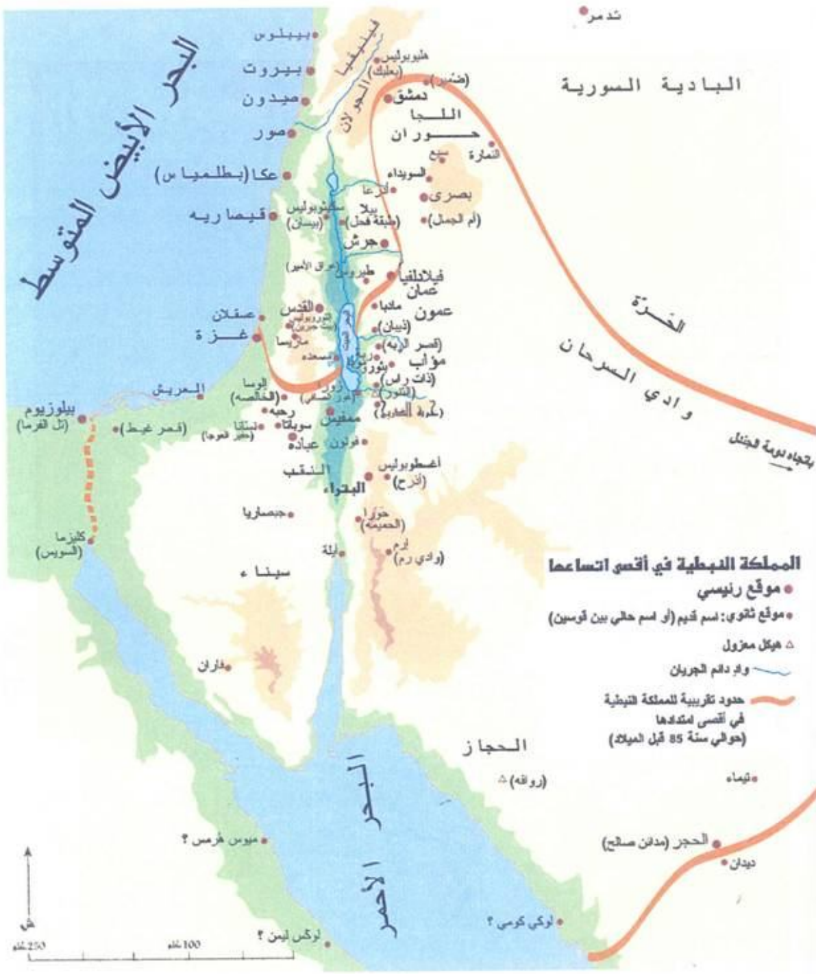
اتساع رقعة المملكة النبطية